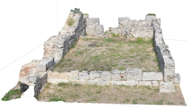
Rilievo digitale della bottega 3 sul lato nord del Foro

Il progetto di ricerca intende dunque comprendere l'evoluzione della piazza cittadina della città romana di Paestum, contribuendo a precisare le fasi di vita dei singoli edifici, sia attraverso la raccolta della documentazione di archivio (fotografie, disegni, appunti editi e inediti, taccuini di scavo conservati nei diversi enti italiani e stranieri) che contiene preziosissime informazioni utili a comprendere la situazione dell'area forense prima che questa venisse alterata da scavi non stratigrafici, sia attraverso lo studio della documentazione di scavo più recente (in particolar modo l'attività della missione italo-francese degli anni Settanta e Ottanta confluita poi nei volumi di Poseidonia-Paestum I, II, III e IV ).