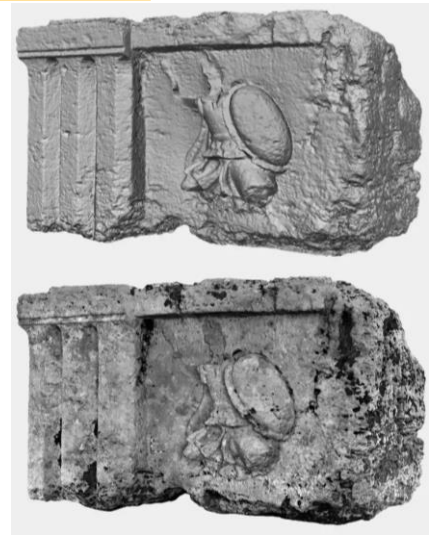
Metopa II del tempio dorico-corinzio del Foro di Paestum, mesh e rilievo 3D (da Albers, Widow, Rimbock, Rafflenbeul, 2020)

Il lavoro, in accordo con le linee guida definite nel Piano Nazionale per la Ricerca (PNR) e nella Strategia Nazionale di Specializzazione Intelligente (SNSI), mira concretamente a creare professionalità e nuove competenze da mettere al servizio della ricerca scientifica con una ricaduta nella valorizzazione del patrimonio culturale che, nel caso specifico, fornirà agli utenti dell'area archeologica di Paestum uno strumento di fruizione consapevole, ricreando scientificamente, anche tramite l'uso di realtà aumentata, le varie fasi di vita del complesso forense.