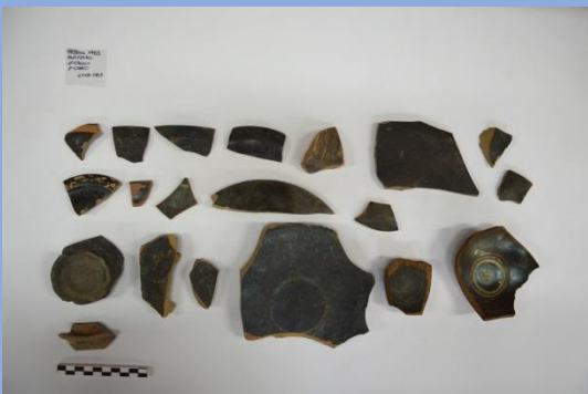
Fig. 3 Ceramica a vernice nera, dall' area dell' Anfiteatro (scavi 1963).